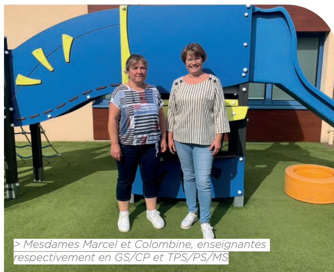
> Mesdames Marcel et Colombine, enseignantes respectivement en GS/CP et TPS/PS/MS